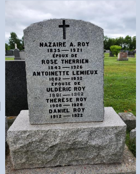
Cimetière Saint-Vallier, lot 6