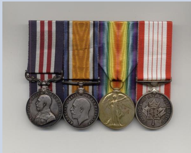
British war & Victory medals