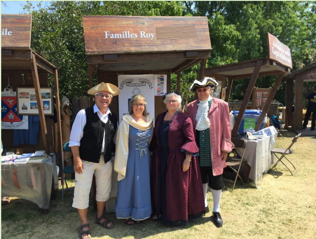
Fête de la Nouvelle-France en 2019