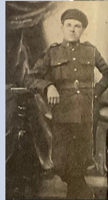
Bruxelles, 20 mars 1917