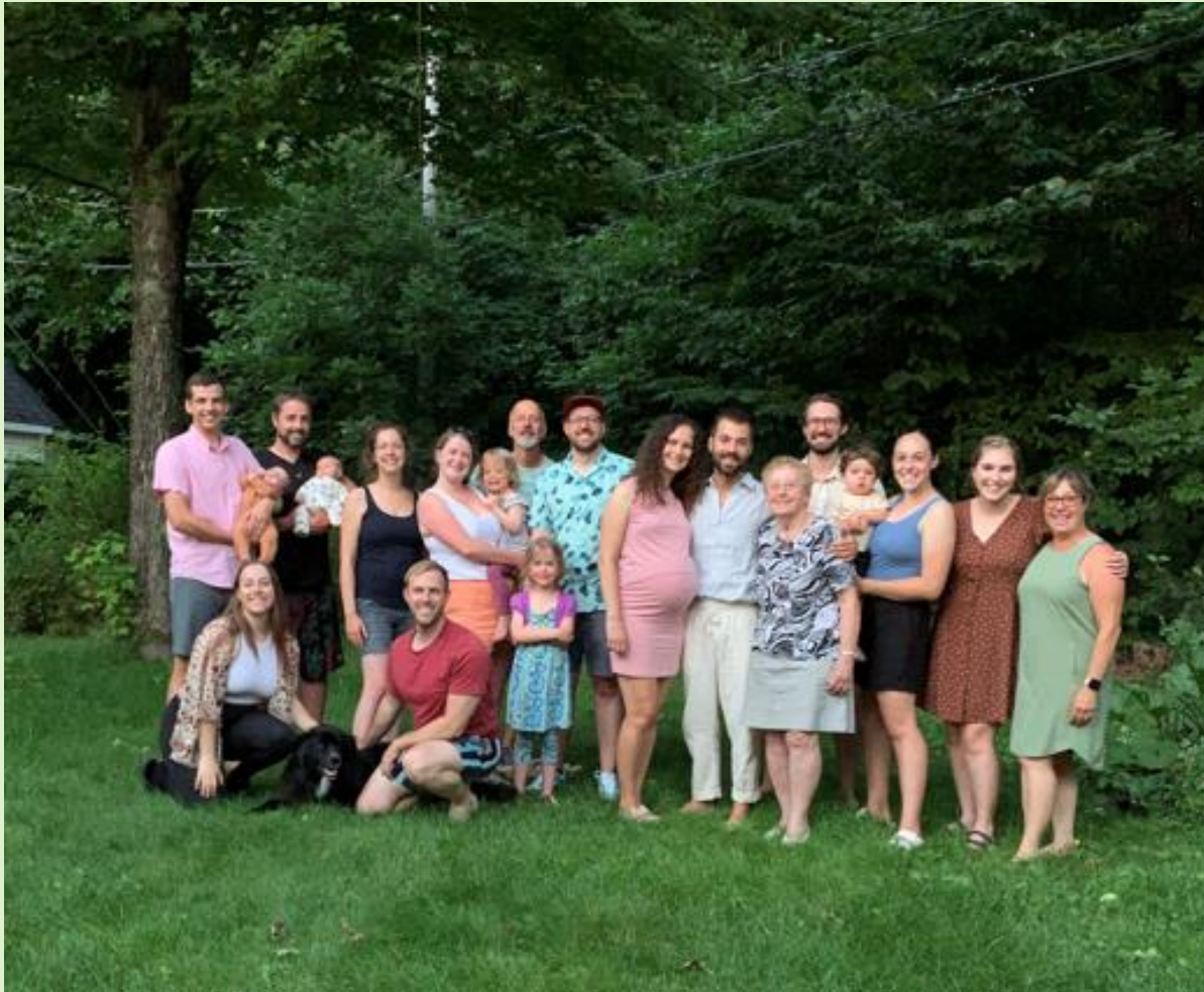
Photo de la famille avec neveux et nièces sur 4 générations prise en 2024.