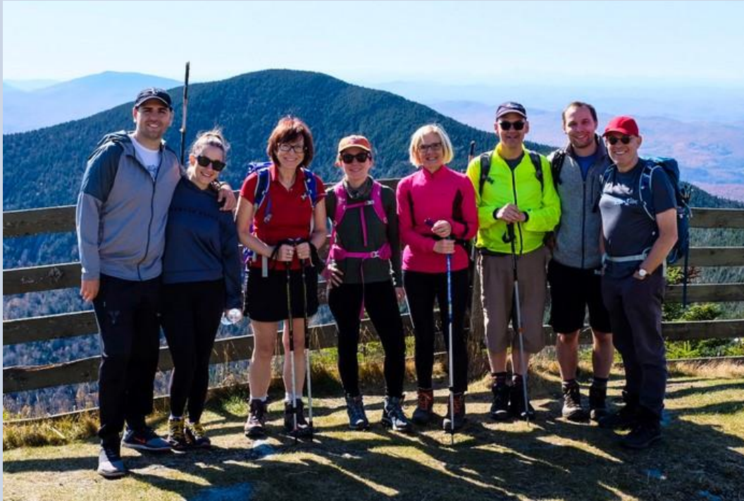
2020 - Grimper le Kilimandjaro, le plus haut sommet d'Afrique