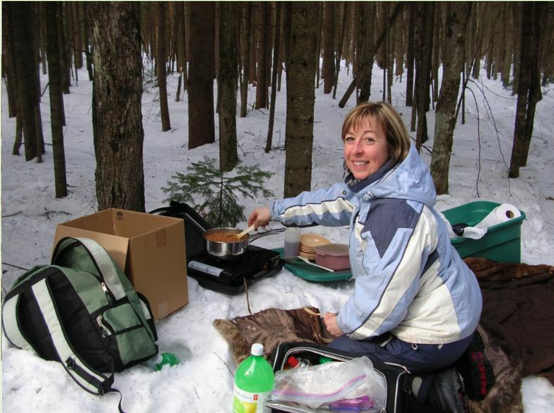
Activité bénévole pour les scouts (repas en forêt)