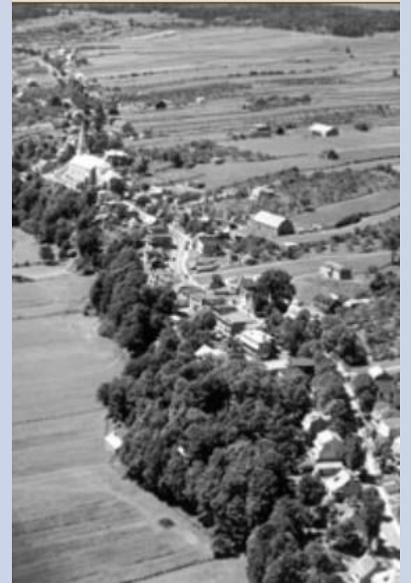
Côte-de-Beupré début XXe siècle