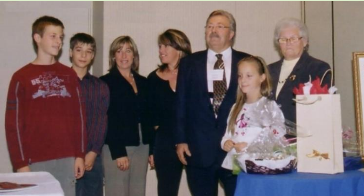
Photographie Pierre Lauzier (2008)

Digne descendante de Nicolas Leroy et Jeanne Lelièvre